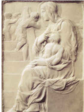
1493 aprox. Miguel Ángel: Virgen de la escalera Florencia Casa Buonarroti.