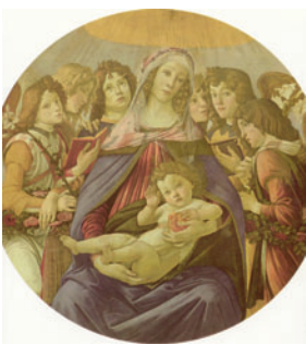
1487 Botticelli: Madonna de la Granada .

Y es que eso es algo que hace ya mucho que, sencillamente, no se da. Por más que eso nos ciegue ante las manifestaciones masivas de lo contrario que nuestra cultura nos ofrece: echen ustedes un vistazo a las Vírgenes con el niño Jesús en sus brazos del renacimiento y del barroco y díganme que no les resultan deseables.