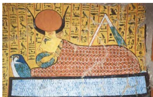
divinidad egipcia mitad vaca,