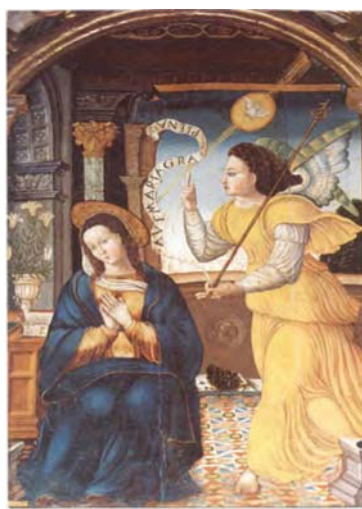
1 LUCAS 1:26-38, Biblia de Jerusalén , Desclee de Brower, Bilbao, 1979.

¿Una virgen embarazada? ¿Cuántos debates no se han producido en la historia de Occidente a propósito del asunto de la divina concepción de la Virgen? Incluso constituyó punto decisivo de conflicto en el cisma que opuso la Reforma a la Contrarreforma.